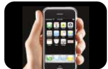
آیفون، نخستین گوشی تماماً صفحه‌لمسی دنیا