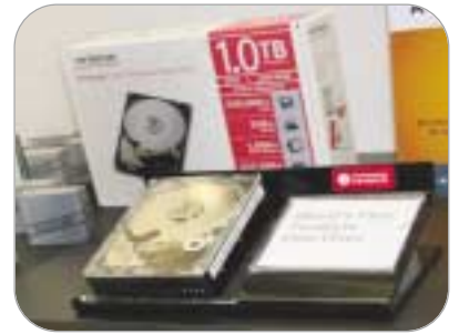
دیسک ۱ ترابایتی