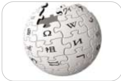
ویکی‌پدیا، دانشنامه آزاد جهانی