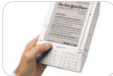
کیندل، دستگاه کتاب‌خوان الکترونیک