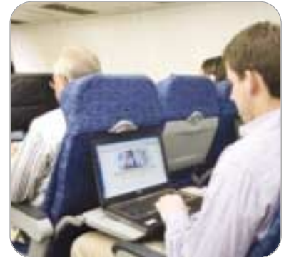
شرکت Aircell که در حوزه سیستم‌های وای‌فای پروازی فعالیت می‌کند، در اولین سال حضور خودش

در این عرصه، سرویس اینترنت وای‌فای را با همکاری شرکت‌های بزرگ هواپیمایی آمریکا به‌راه انداخت. در ابتدای سال ۲۰۰۹ این شرکت اعلام کرده بود که سرویس وای‌فای خود را در خط نیویورک تا کالیفرنیا فعال کرده است، اما از جمعه گذشته، اولین پرواز با سرویس کامل اینترنت انجام شد و به گفته خط هوایی United، این شرکت تمام ۱۳ بویینگ خود را به تجهیزات وای‌فای ایرسل مجهز خواهد کرد. این شرکت، خدمات اینترنت در حال پرواز را با مبلغ